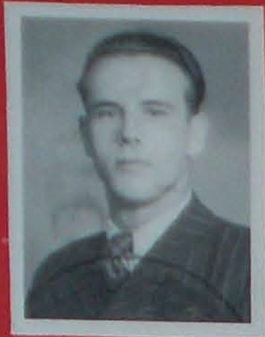
Urodził się 7.10.1919 roku w Warszawie.