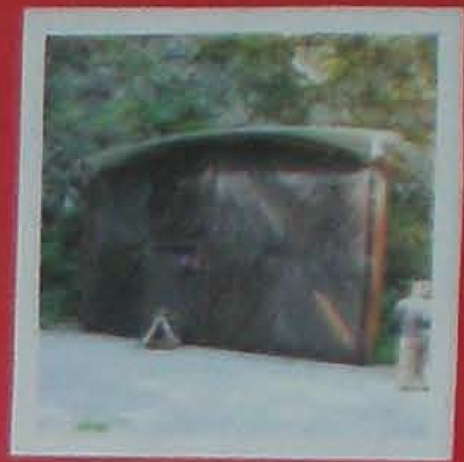
W tym samym roku wywieziony do Mauthausen.

Od kwietnia 1940 roku przez 3 lata więziony na Pawiaku w Warszawie.